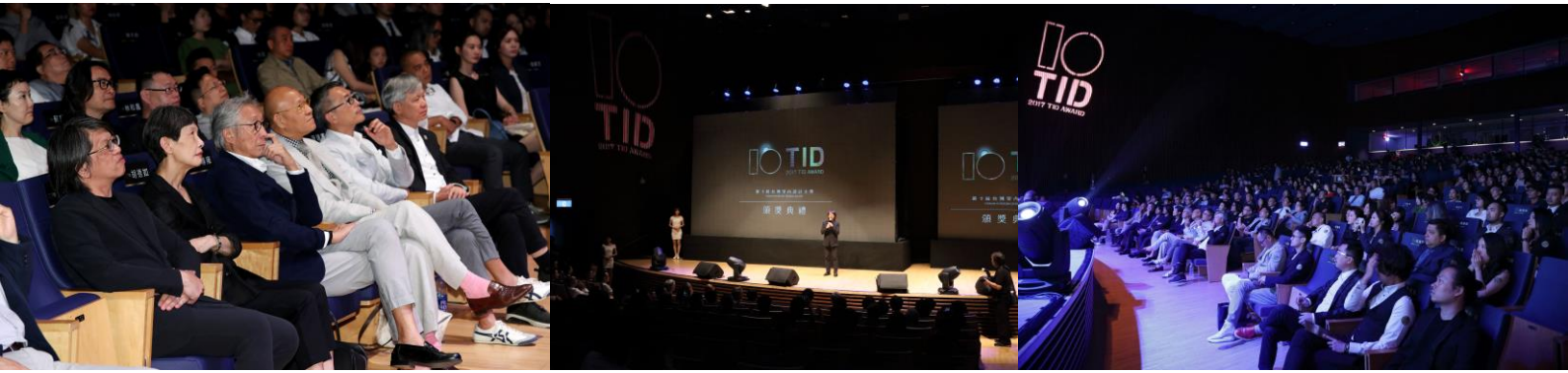
頒獎典禮