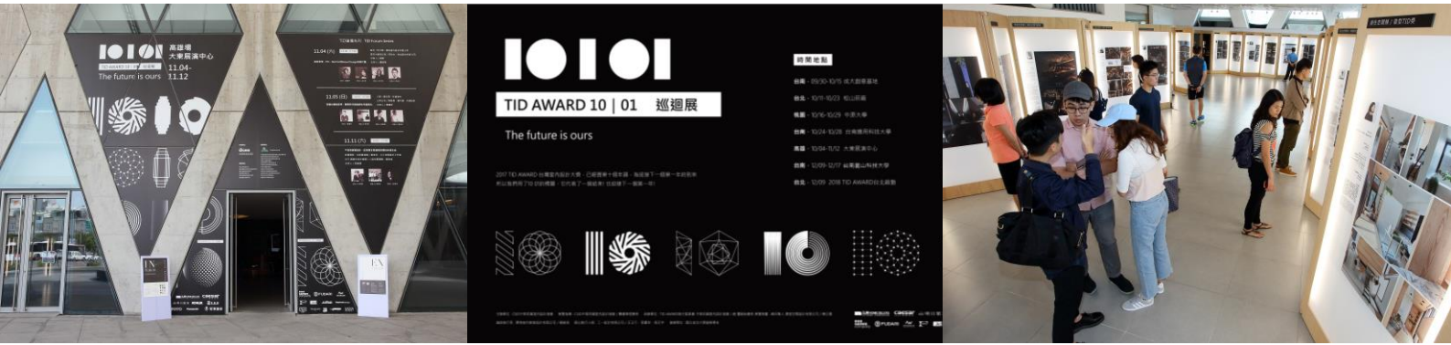
得獎作品巡迴展/高雄大東藝術文化中心