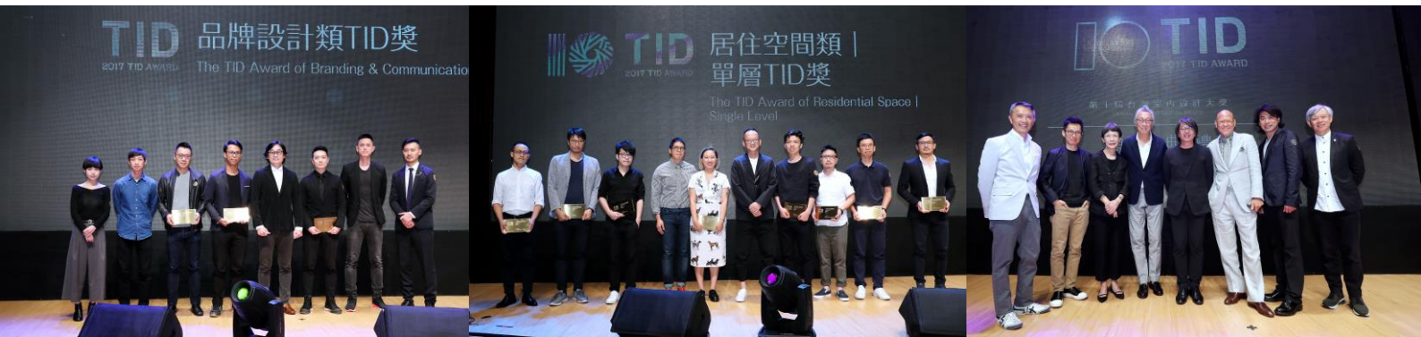
頒獎典禮/台中市政府