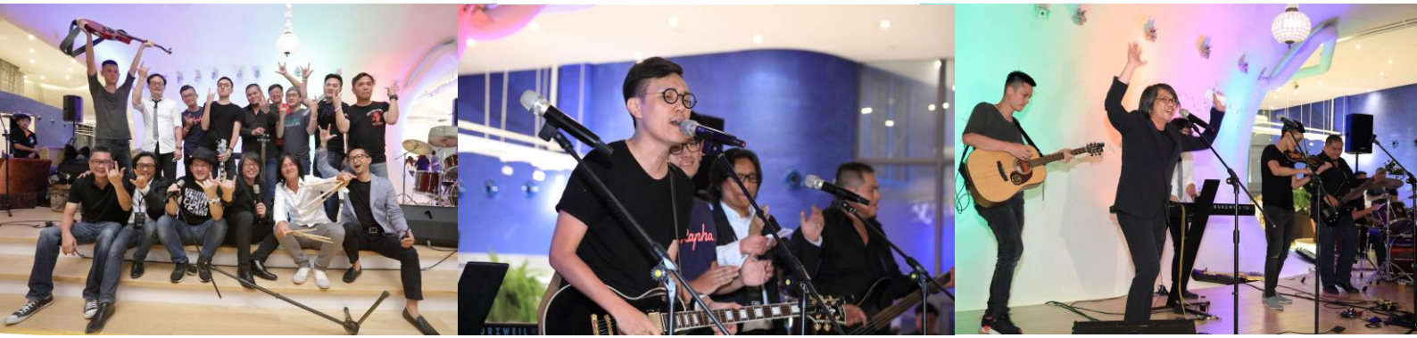
設計師之夜/台中歌劇院