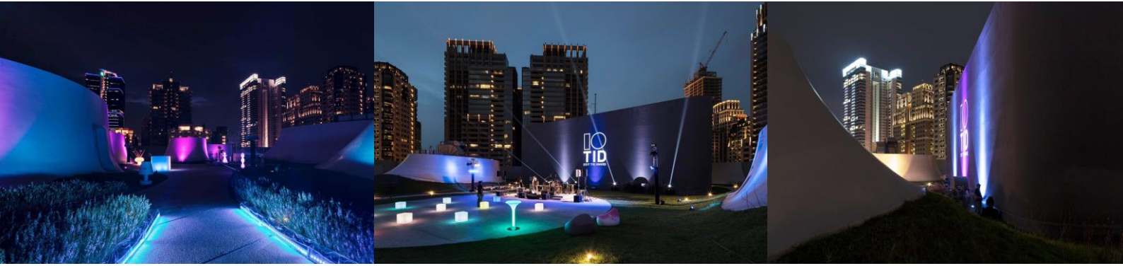
設計師之夜/台中歌劇院